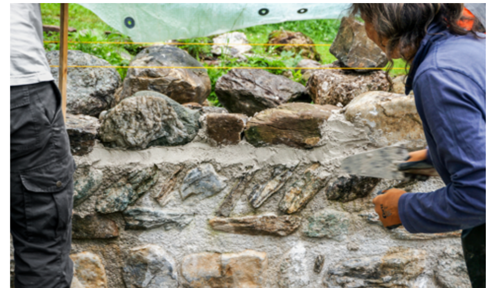
Alle Steine der Mauerschicht sind gesetzt. Leta Büechi hat die Fuge ausgeworfen und streicht diese noch glatt. Am nächsten Tag wird sie dann abschliessend gekratzt und gebürstet.