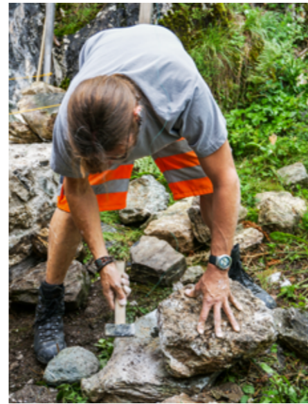
Einige der für die Mauer ausgewählten Bruchsteine gilt es zuerst noch zu bearbeiten.