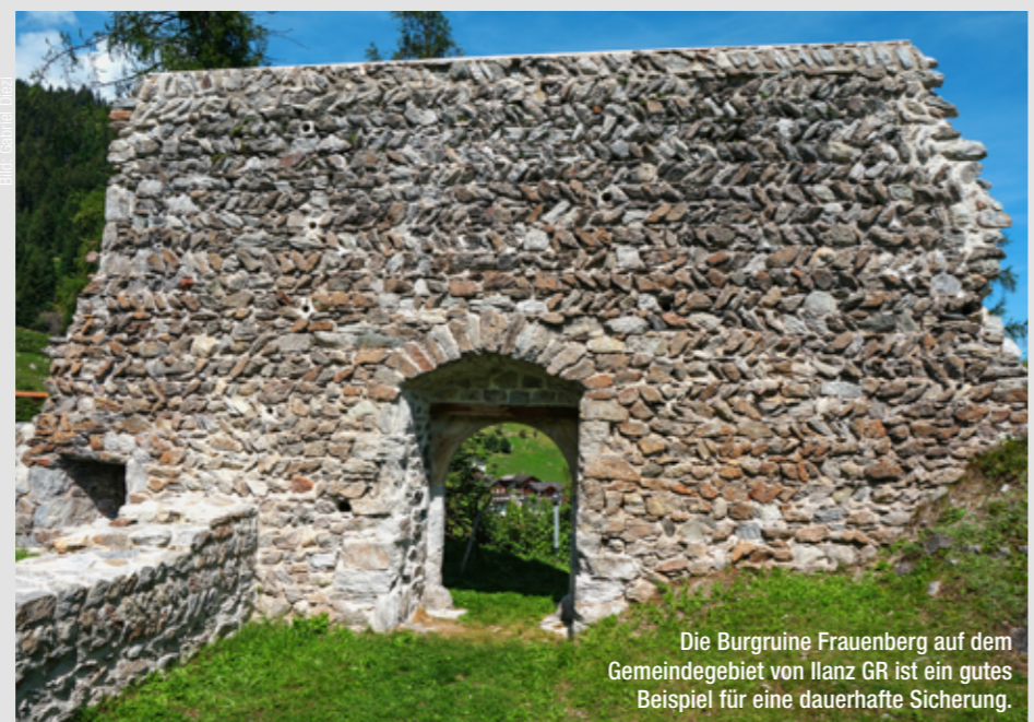
Die Burgruine Frauenberg auf dem Gemeindegebiet von Ilanz GR ist ein gutes Beispiel für eine dauerhafte Sicherung.

Sanierungsmörtel saniert, davon sieben im Kanton Graubünden. Und sogar bei der Restaurierung der berühmten Steinbrücke im jurassischen St. Ursanne kam der «Bündner Burgenmörtel» kürzlich zur Anwendung. Gabriel Diezi