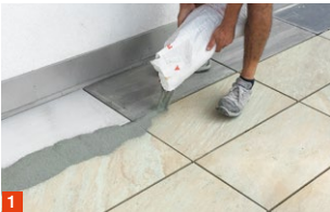
1 Material verteilen