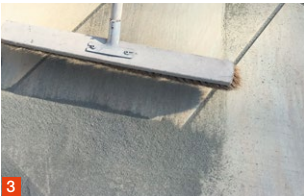
3 Material einkehren