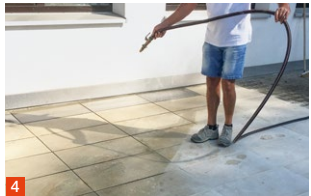
4 Fläche mit Wasser benässen