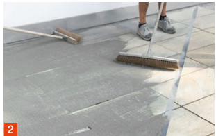
2 Material einbringen