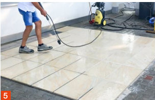
5 Fäche reinigen