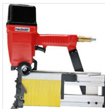
Agrafeuse à air comprimé