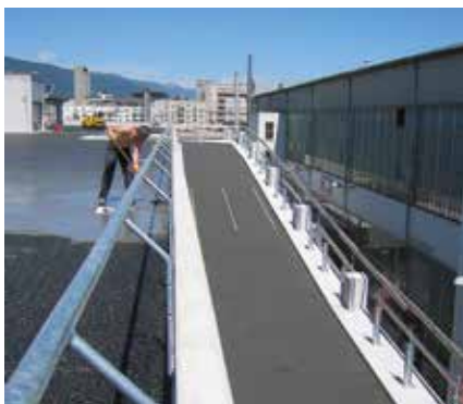
Parkirne garaže uključujući prilazne putove