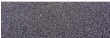
Nanošenje sitnog pijeska

Zavisno od intenziteta brušenja mogu se ukloniti male nepravilnosti, a može se postići vrlo ravna površina slična terrazzu.