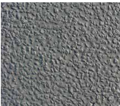
Creteo®Phalt - gotova obloga

Creteo®Phalt malter posebno je razvijen za ispunjavanje poroznih asfaltnih konstrukcija sa šupljinama. Creteo®Phalt malter obilježava vrlo kratko vrijeme vezivanja u kombinaciji s vrlo brzim stvrdnjavanjem, a time i brzo puštanje u pogon i opterećenje površine već nakon 12–18 sati. Creteo®Phalt malter kompenzira skupljanje, zbog čega se smanjuju mikropukotine na površini i izbjegavaju štetne pukotine u konstrukciji. Sistemski uslovljene pukotine su moguće i regulisane pomoću RVS 08.16.03/2014.