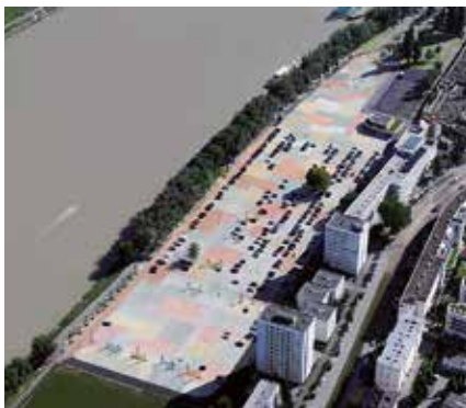
Površine za industrijsko skladištenje