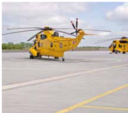
Ceste i parkirna mjesta na aerodromima