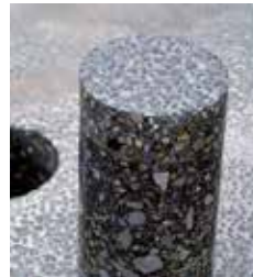
Creteo®Phalt na ASFALTU