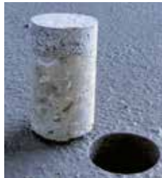
Creteo®Phalt na HVNS

Probna je jezgra (uzorak) uzeta s površine na teretnom terminalu, na kojem dnevno voze vozila s opterećenjem kotača od 100 tona.